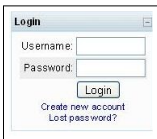
Ilustracija 2: Registracija